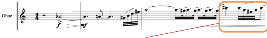
ตัวอย่างที่ 7B จัดใหม่ให้เป็นโน้ต มี โด ลา โด มี ในบทเพลงมกชะ

ผู้แต่งเป็นคนเมืองเหนือของจังหวัดเชียงใหม่โดยกำเนิด ได้มีโอกาสได้ชื่นชมดนตรีพื้นบ้านอยู่ในหลาย ๆ โอกาส ผู้วิจัยมีความชอบในดนตรีไทยและพื้นบ้านที่มีลักษณะการด้นสด (Improvisation) จากทำนองหลักในขณะบรรเลงพร้อมกันของแต่ละเครื่องดนตรีทำให้ได้เสียง ในแบบที่เรียกว่า Heterophony ผู้แต่งได้ดึงเอกลักษณ์นี้มาประยุกต์ใช้เพื่อเป็นแรงบันดาลใจในบทเพลงมกชะ ผู้แต่งได้เขียนให้แต่ละเครื่องดนตรีบรรเลงในอัตราความช้า-เร็วที่แตกต่างกัน แต่บรรเลงออกมาประสานกันในเวลาเดียวกัน (poly tempo) ทำให้ได้กลิ่นเสียงที่ดำเนินไปพร้อม ๆ ดังตัวอย่างที่ 8