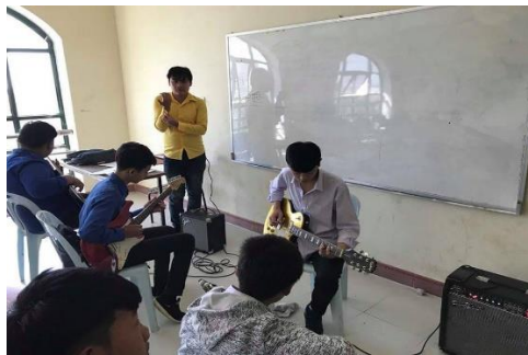
ภาพที่ 7 บรรยากาศการเรียนการสอนในวิชาทักษะปฏิบัติ โรงเรียนศิลปะแห่งชาติ สปป.ลาว

ได้แก่ คีบอร์ด กีตาร์ไฟฟ้า กีตาร์เบส เป็นต้น การเรียนการสอนวิชากีตาร์ไฟฟ้าและกีตาร์จะเริ่มจากการฝึกสเกลบันไดเสียงต่าง ๆ แบบฝึกหัด บทเพลงสากลทั่วไป เทคนิคการบรรเลง สีอารมณ์ จนเมื่อนักเรียนมีความสามารถในการบรรเลงได้ดีก็จะมีการแสดงโชว์ความสามารถได้