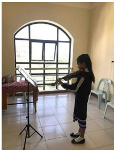
ภาพที่ 5 บรรยากาศการเรียนการสอนในวิชาทักษะกลุ่มเครื่องสาย โรงเรียนศิลปะแห่งชาติ สปป. ลาว