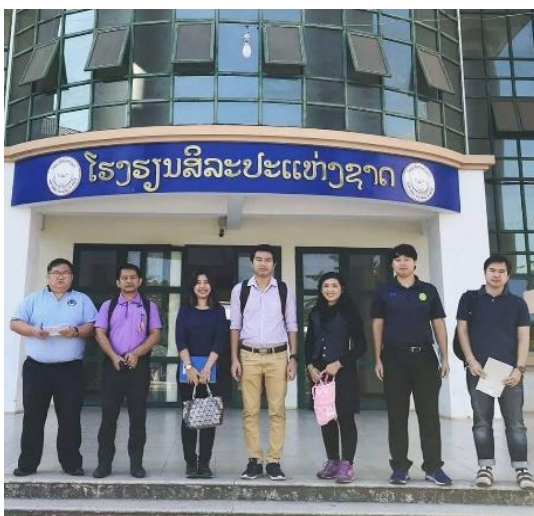
ภาพที่ 2 การเยี่ยมชมศึกษาหลักสูตรการเรียนการสอน โรงเรียนศิลปะแห่งชาติ สปป.ลาว

ปัจจุบันมีการเรียนการสอนดนตรีสากลหรือดนตรีตะวันตก เนื่องจากดนตรีตะวันตกมีอิทธิพลและมีส่วนสำคัญต่อการพัฒนาการศึกษา การถ่ายทอดทักษะทางด้านดนตรี เพื่อเป็นการแสดงศักยภาพทางด้านดนตรีการเผยแพร่ศิลปวัฒนธรรม โดยใช้เพลงพื้นเมืองบรรเลงด้วยเครื่องดนตรีตะวันตก มีการแลกเปลี่ยนเรียนรู้ด้านวัฒนธรรมกับประเทศเพื่อนบ้านนานาประเทศโดยเฉพาะแถบเอเชีย โดยมีระยะเวลาในการเรียนการสอนนักเรียนแต่ละรุ่น 7 ปี โดยนักเรียนที่จบในชั้นประถมศึกษาหรือชั้นประถมศึกษาปีที่ 5 ก็จะมาสมัครสอบเข้าในสิ่งที่ตนเองสนใจเรียนที่โรงเรียนศิลปะแห่งชาติ สปป.ลาว แห่งนี้ หากนักเรียนคนใดมีความชื่นชอบ มีทักษะความสามารถ หรือมีพรสวรรค์ ก็จะได้ถูกคัดเลือกให้เข้าเรียนที่โรงเรียนแห่งนี้ โดยใช้ระยะเวลาเรียนทั้งหมด 7 ปี (ตั้งแต่ ม.1-ม.7) และหากมีนักเรียนที่เรียนจบการศึกษาแล้วคนใดมีความต้องการจะเรียนต่อทางดนตรีตะวันตกเพื่อจะประกอบอาชีพครูก็จะมี การส่งเสริมให้ก้าวไปศึกษาต่อระดับปริญญาตรีในต่างประเทศอีกด้วย