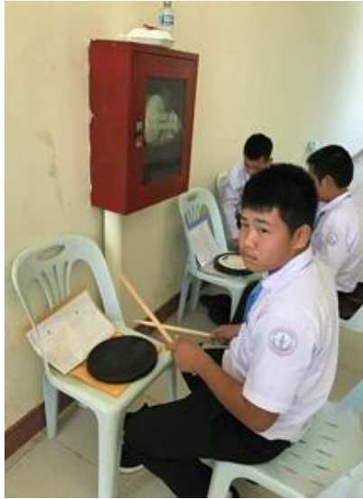
ภาพที่ 4 บรรยากาศการเรียนการสอนในวิชาทักษะปฏิบัติกลองชุด โรงเรียนศิลปะ แห่งชาติ สปป.ลาว