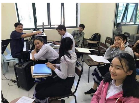
ภาพที่ 6 บรรยากาศการเรียนการสอนในวิชาทักษะขับร้อง โรงเรียนศิลปะแห่งชาติ สปป.ลาว

การขับร้องมีทั้งการขับ พื้นบ้านพื้นเมือง การขับจ๊ิม การขับร้องสากล โดยจะมีลักษณะการสอนหรือการถ่ายทอดโดยใช้เปียโนเป็นเครื่องดนตรีหลัก ครูผู้สอนก็จะมีแยกเป็นแต่ละประเภท การขับร้องจะมีนักเรียนมากเป็นพิเศษเนื่องจากไม่ต้องใช้เครื่องดนตรีและพื้นฐานเดิมส่วนใหญ่ักเรียนจะมีความคุ้นเคยการขับอยู่แล้ว