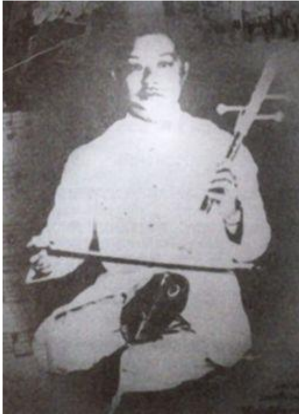
ภาพที่ 3 ทุนกระหม่อมบริพัตรทรงซอสามสาย

ในขณะที่พระองค์ทรงดำรงตำแหน่งผู้บัญชาการทหารเรือ นั้น นอกจากจะทรงปรับปรุงกองทัพเรือแล้วยังทรงโปรดให้ตั้งแตรวงทหารเรือขึ้น และทรงเสด็จไปฟังการฝึกซ้อมเป็นประจำ เมื่อแตรวงทหารเรือสามารถบรรเลงเพลงได้พอสมควรแล้ว พระองค์ก็ทรงหาเวลาว่างเพื่อนิพนธ์เพลงสำหรับแตรวงทหารเรือขึ้น และทรงประทานให้แตรวงทหารเรือบรรเลงในโอกาสต่าง ๆ เช่น เพลงวอลตซ์ประชุมพล ซึ่งพระองค์ทรงตั้งใจนิพนธ์ขึ้นเพื่อให้เป็นเพลงประจำกองทัพเรือ หลังจากนั้นพระองค์ทรงนิพนธ์บทเพลงสำหรับแตรวงหรือวงโยธวาทิตขึ้นมาอีกหลายเพลงด้วยกัน เช่น เพลงสุดเสนาะ เพลงมณฑาทอง เพลงวอลตซ์เมขลา เพลงมหาฤกษ์ เพลงสรรเสริญเสือป่า เพลงวอลตซ์โนรี เพลงสาครลั่น เพลงโตก และเพลงนางครวญ 3 ชั้น ก็เกิดตามกันมา นอกจากเพลงสากลที่พระองค์ทรงนิพนธ์ไว้แล้ว ด้านเพลงไทย