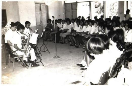
ภาพที่ 1 งาน “นิทรรศการดนตรี” วิทยาลัยครูบ้านสมเด็จเจ้าพระยา จัดครั้งแรกเมื่อ พ.ศ. 2514

เมื่อพื้นเป็นพิพิธภัณฑ์ดนตรีเต็มตัวไม่ได้ด้วยข้อจำกัดงบประมาณสถานที่ เครื่องดนตรีเหล่านี้ก็ควรเป็นส่วนหนึ่งทำหน้าที่บอกเล่า “ความเป็นมาของวิชาดนตรีในบ้านสมเด็จฯ” ร่วมกับข้อมูลอื่นๆ รอบด้านที่บรรจุไว้ในห้องเดียว ไม่ว่าจะ เป็น ประวัติการก่อตั้ง บ้านสมเด็จฯ ในบริบทสังคมดนตรี คณาจารย์ ผู้บริหาร นักศึกษา ผลงาน ถ้วยโล่รางวัลเกียรติยศ รวมถึงข้อมูลภาพถ่ายเก่ากิจกรรมดนตรี บ้านสมเด็จฯ ตั้งแต่ พ.ศ. 2514 จำนวน 8,636 ใบ 5 ที่ถือเป็นบันทึกจดหมายเหตุ ชั้นเยี่ยมอย่างดี เทปคาสเซ็ท วิดีโอ ซีดีและดีวีดีเพลงรวมกว่า 1,000 รายการ 6 ทำงานร่วมกับห้องสมุดดนตรีที่วิทยาลัยฯ ตั้งชื่อแล้วว่า “สังัด ภูเขาทอง” ออกแบบเป็นห้องที่บหรือกระจกที่ทุกคนต้องเดินผ่านเพื่อไปสู่ห้องสมุดหรือร้านค้า วิทยาลัยฯ แล้วจัดการเชื่อมโยงเปิดเป็นเครือข่ายกับพื้นที่วัฒนธรรมอื่นๆ ของมหาวิทยาลัยราชภัฏบ้านสมเด็จฯ ไม่ว่าจะเป็น หอเกียรติยศ แหล่งเรียนรู้ธนบุรี ศึกษา บ้านเอกะนาค เพื่อเคลื่อนไหวไม่ปิดตายกลายเป็นที่อยู่ของฝุ่น อย่างที่ อาจารย์สังัด ภูเขาทอง เขียนบอกใน “อนิตยสารรายไม่แน่นอน” ฉบับรายงาน ความล้มเหลว