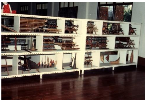
ภาพที่ 8 ภาพการจัดแสดงเครื่องดนตรีถาวรแบบพิพิธภัณฑน์ ภายในโถงชั้น 2 อาคารวิเศษวิเศษศุภวัตร วิทยาลัยครูบ้านสมเด็จเจ้าพระยา ใช้ชื่ออย่างเป็นทางการว่า “พิพิธภัณฑน์ดนตรีเพื่อการศึกษา”