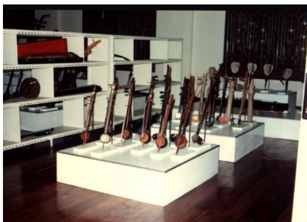
ภาพที่ 9 ภาพการจัดแสดงเครื่องดนตรีถาวรแบบพิพิธภัณฑน์ ภายในโถงชั้น 2 อาคารวิเศษวิเศษศุภวัตร วิทยาลัยครูบ้านสมเด็จเจ้าพระยา ใช้ชื่ออย่างเป็นทางการว่า “พิพิธภัณฑน์ดนตรีเพื่อการศึกษา”