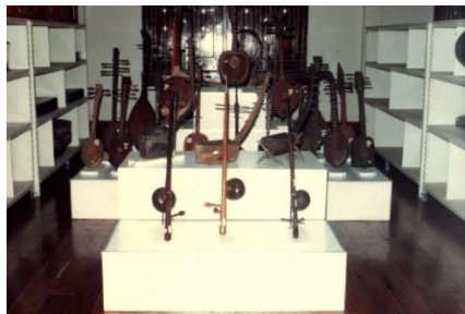
ภาพที่ 7 ภาพการจัดแสดงเครื่องดนตรีถาวรแบบพิพิธภัณฑ์ ภายในโถงชั้น 2 อาคารพิเศษพิเศษศุภวัตร วิทยาลัยครูบ้านสมเด็จเจ้าพระยา ใช้ชื่ออย่างเป็นทางการว่า “พิพิธภัณฑ์ดนตรีเพื่อการศึกษา”