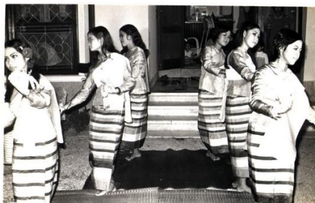
ภาพที่ 2 งาน “นิทรรศการดนตรี” วิทยาลัยครูบ้านสมเด็จเจ้าพระยา จัดครั้งแรกเมื่อ พ.ศ. 2514