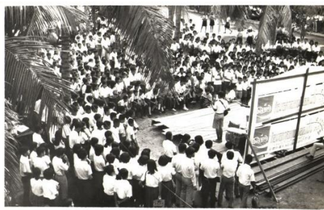
ภาพที่ 3 งาน “นิทรรศการดนตรี” วิทยาลัยครูบ้านสมเด็จเจ้าพระยา จัดครั้งแรกเมื่อ พ.ศ. 2514