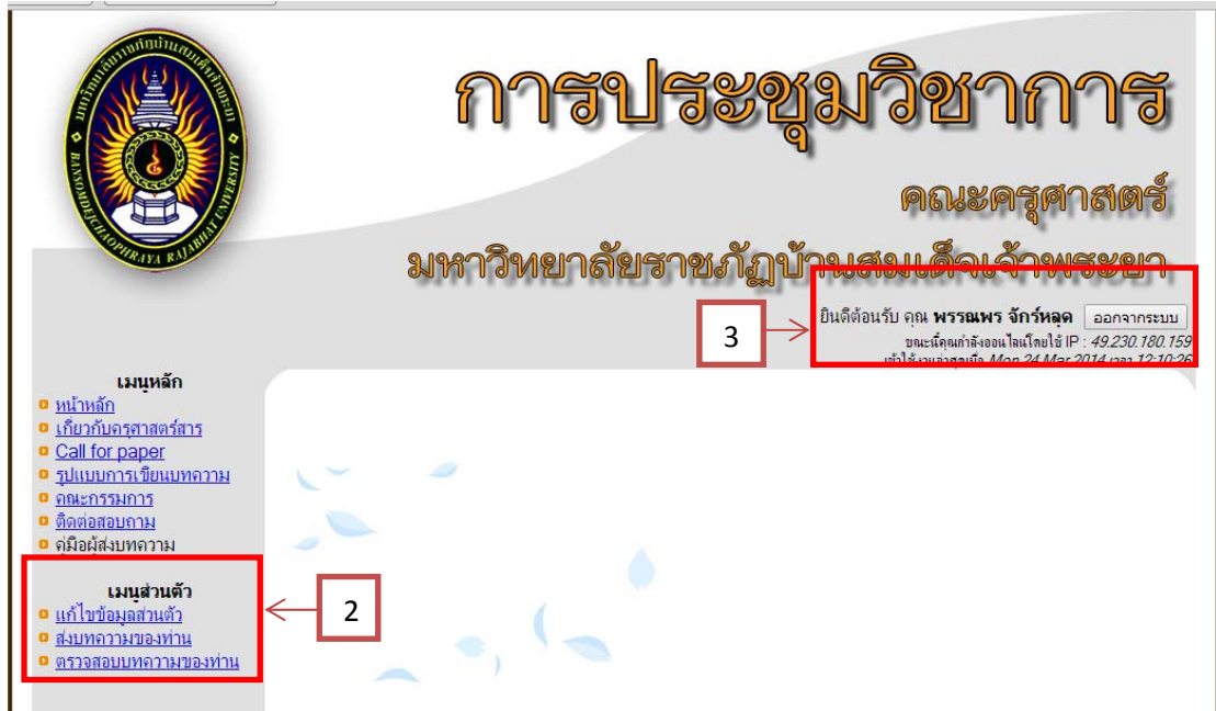
ภาพที่ ค-4 หน้าเข้าสู่ระบบ

4. เมื่อ Login มาแล้วจะมีเมนูผู้ใช้งานอยู่ใต้กลุ่มเมนูหลักตามหมายเลข 2 และขึ้นชื่อผู้ใช้งานตามหมายเลข 3