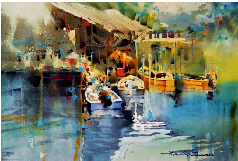
รูปที่ 9 สภาพแวดล้อมล้วนให้ประสบการณ์ทางศิลปะ โดย นพดล เนตรดี 2564

ช่วงเวลาหนึ่งในชีวิต ข้าพเจ้าได้เติบโตและมีพื้นเพเป็นเด็กจากชนบทชายทะเล ฝั่งตะวันออกของประเทศไทย ประกอบกับอุปนิสัยส่วนตัวผูกพันกับธรรมชาติสิ่งแวดล้อมเป็นทุนเดิม เมื่อได้เข้าศึกษาทางด้านศิลปะที่โรงเรียนเพาะช่างและต่อมาได้เป็นอาจารย์ผู้สอนในภาควิชาจิตรศิลป์ วิทยาลัยเพาะช่าง จึงได้นำประสบการณ์ในช่วงเวลานั้นมาใช้ในการจัดการศึกษา โดยได้นำนักเรียน นักศึกษา และผู้สนใจศิลปะได้ท่องเที่ยวแสวงหามุมมองในธรรมชาติที่งดงามตามสถานที่ต่างๆ เพื่อเป็นแรงบันดาลใจในการสร้างผลงานศิลปะ