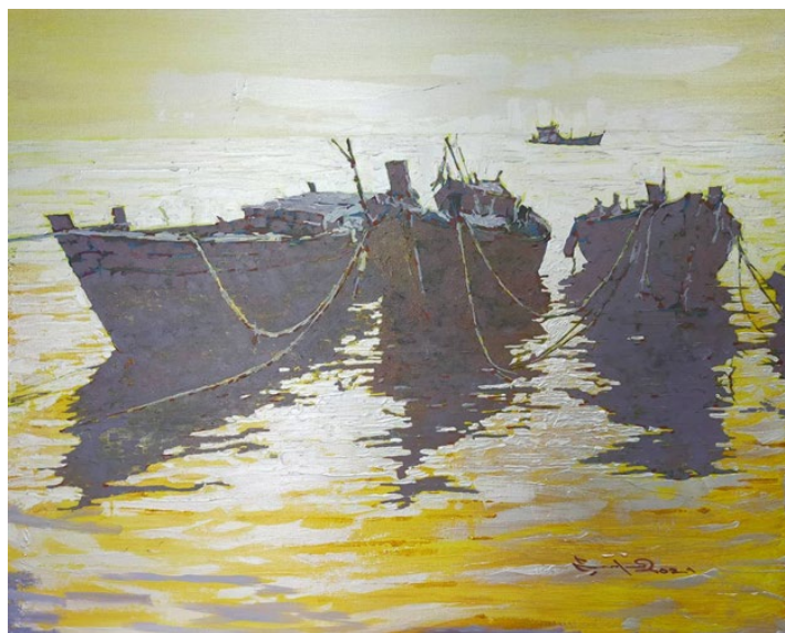
รูปที่ 8 การนำสภาพแวดล้อมโลกภายนอกมาสร้างงานศิลปะ โดย นพดล เนตรดี 2564

อีกสิ่งหนึ่งที่เป็นส่วนสำคัญในการทำงานศิลปะของข้าพเจ้าคือ การมองโลกในแง่ดี มีทัศนระบวงเห็นส่วนรวมสำคัญกว่าส่วนย่อยเสมอ ไม่ชอบความรุนแรง การใช้กำลัง สงคราม ตลอดจนความโศกเศร้าเสียใจ ความผิดหวัง ความกดดัน หรือความทุกข์ระทมต่างๆ