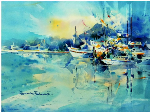
รูปที่ 5 การตัด ทอน ธรรมชาติสภาพแวดล้อมโลกภายนอกเหลือไว้เพียงโครงสร้างหลัก โดย นพดล เนตรดี 2563

ตัดทอน ลดรายละเอียด ส่วนเกินที่ไม่จำเป็นออกไปเหลือไว้เพียงโครงสร้างหลัก นำทฤษฎี รูปและพื้น (Figure and Ground) มาใช้กับรูปร่าง รูปทรง ทิศทาง ตัดทอนตามความรู้สึกว่าเหมาะสม แล้วเปลี่ยนสีตามความเข้มของแสงให้รู้สึกแปลกตาหรือตามแต่จินตนาการดังที่กล่าวไปแล้วว่าแรงบันดาลใจของภาพวาดชุดนี้คือภูมิทัศน์ธรรมชาติสภาพแวดล้อมโลกภายนอกได้แก่ น้ำ ฟา ป่า ภูเขา เป็นเรื่องราวที่ถ่ายทอดรูปแบบที่ข้าพเจ้าได้พบเห็น นำมาเป็นต้นเค้าของแรงบันดาลใจ โดยใช้สีโปสเตอร์เป็นสื่อวัสดุถ่ายทอดลงบนกระดาษ เป็นผลงาน