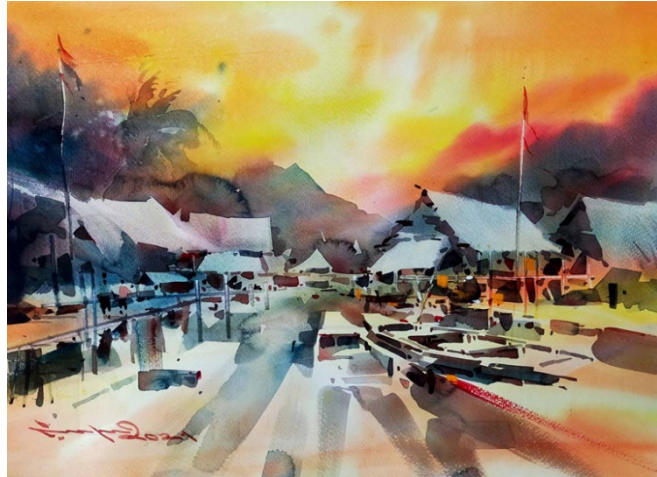
รูปที่ 7 ธรรมชาติสภาพแวดล้อมโลกภายนอก สภาพแวดล้อมโลกภายนอกมาสร้างงานศิลปะ โดยนพดล เนตรดี 2564

สำหรับคนทำงานศิลปะเช่นข้าพเจ้ามองเห็นธรรมชาติสภาพแวดล้อมโลกภายนอก เป็นรูปร่างที่อิสระ เป็นเส้นสีเขียวครีม เห็นสีครามของน้ำทะเลที่งดงาม ระลอกคลื่น เห็นความเขียวขจีของป่าไม้ ภูเขา ความแว้งว้าง ความสงบร่มเย็น ความสุข ความอุดมสมบูรณ์ของชีวิต ภายใต้วิถีชีวิตที่เรียบง่าย การได้ใกล้ชิดกับธรรมชาติ