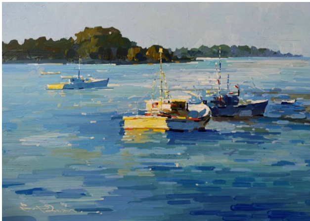
รูปที่ 4 การตัด ทอน ธรรมชาติสภาพแวดล้อมโลกภายนอกเหลือไว้เพียงโครงสร้างหลัก โดย นพดล เนตรดี 2563