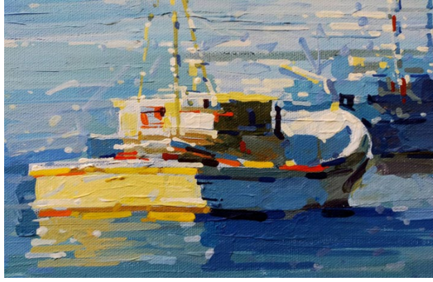
รูปที่ 3 การตัด ทอน ธรรมชาติสภาพแวดล้อมโลกภายนอกเหลือไว้เพียงโครงสร้างหลัก โดย นพดล เนตรดี 2563