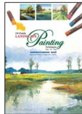
รูปที่ 6 ผลงานหนังสือของข้าพเจ้า โดย นพดล เนตรดี

ประการที่สอง ข้าพเจ้าปราศจากการกดดันใดๆ จึงกล้าตัดสินใจสร้างงานศิลปะอย่างต่อเนื่องโดยยึดหลักธรรมชาติสภาพแวดล้อมโลกภายนอกมาเป็นแรงบันดาลใจ