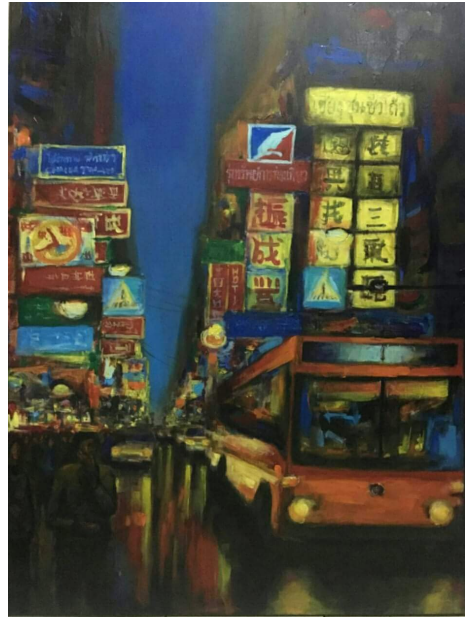
ภาพที่ 1 ถนนเยาวราช สีอะคริลิคบนผ้าใบ ขนาด 90 x 120 ซม. ภาพที่ 2 สาย 1 สีอะคริลิคบนผ้าใบ ขนาด 90 x 120 ซม.

ชุดสี มีความสอดคล้องกับผลงานของ Van Tame มีชุดสีคู่ตรงข้ามที่หลากหลาย สีที่ใช้มีความสดและรุนแรงมีชุดสีคู่ตรงข้ามที่หลากหลาย และมีการใช้กลุ่มสีอ่อนใช้ในบริเวณตรงกลางภาพ มีการใช้สีโทนร้อนให้เกิดความรุนแรงการย้วย การละลายของสี มีชุดสีคล้ายบริเวณจุดที่มีด