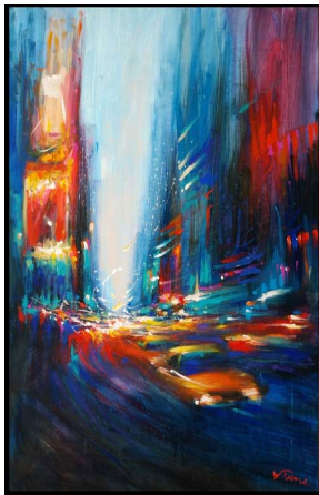
Autumn in New York

เส้นและสี ด้วยสีอะคริลิกบนผ้าใบครั้งที่ 2 จำนวน 2 ภาพ เป็นเครื่องมือประกอบคำสัมภาษณ์ครั้งที่ 2 นำเสนอผู้เชี่ยวชาญชุดเดิมพิจารณาประเมินคุณภาพงานสร้างสรรค์โดยฉันทามติ อันเป็นขั้นตอนสุดท้าย และทำการสรุปผลการวิจัย