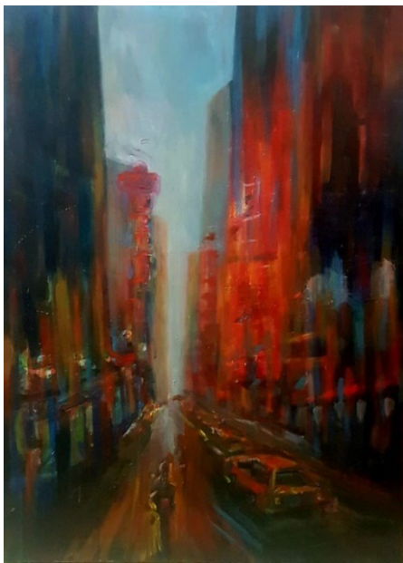
ภาพที่ 1 เขียวราช สีอะคริลิคบนผ้าใบ ขนาด 80x110 ซม.

ลักษณะเส้น มีความสอดคล้องกับผลงานของ Van Tame ควรเพิ่มรายละเอียดของเส้นจริง นำยังจุดนำสายตาทำให้ภาพเกิดมิติ ให้ทิศทางของเส้นสอดคล้องกัน เพื่อนำไปยังจุดนำสายตา และเพิ่มเส้นขอบให้มีความชัดเจนยิ่งขึ้น