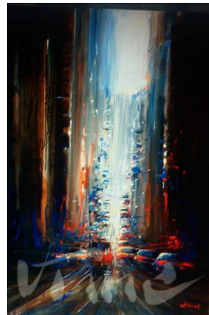
In Canyon of Steel