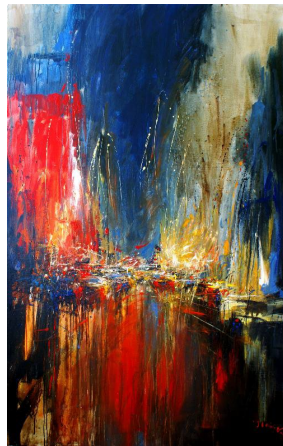
Into the Jungle