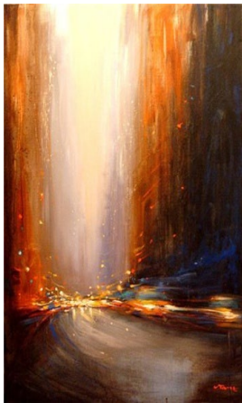
Another Day in NYC