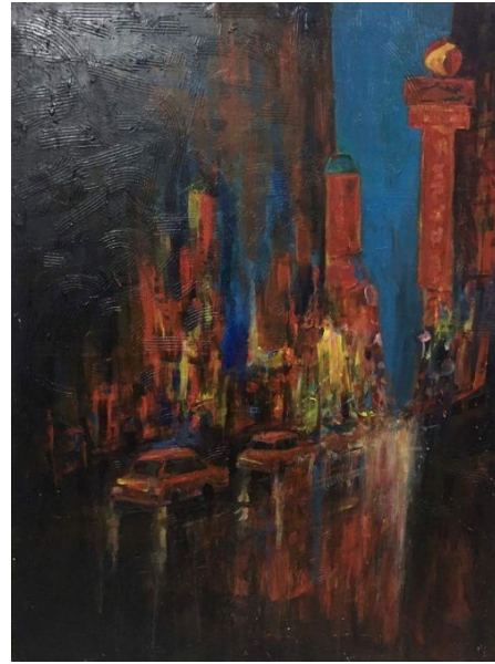
ภาพที่ 3 ไขนาทาวน สือะคริลิคบนผ้าใบ ขนาด 90x120 ซม. ภาพที่ 4 ทิวทัศน์เมืองในยามค่ำคืน สือะคริลิคบนผ้าใบ ขนาด 90x120 ซม.

รูปร่างรูปทรง มีความสอดคล้องกับผลงานของ Van Tame ควรเพิ่มรายละเอียดรูปทรงอิสระ เช่น ก้อนเมฆ หรือต้นไม้ ให้มีความหลากหลายมากขึ้น และเพิ่มรายละเอียดของรูปทรงกลม เช่น จุดแสงจากไฟยานพาหนะ หรือไฟตามอาคาร เป็นต้น